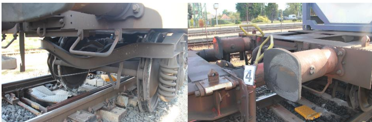
1. kép: Közlekedő vonat balesete Hegyeshalom állomáson 2023.10.05-én