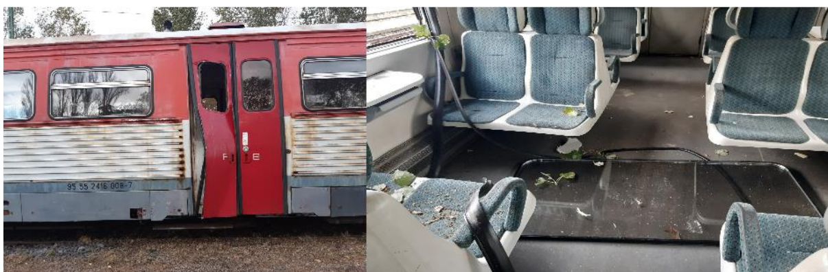
2. kép: Vonat ütközése úrszelvényben lévő akadállyal (faág) Mátéházapuszta és Baja állomások között, 2023.10.27.

Okok: jellemzően kidőlt fák, úrszelvénybe benyúló faágak (tizenhét eset), kettő esetben felsővezetési elem anyagfáradásos törése, három esetben gondatlanság, egy biztonsági intézkedés elmaradása, egy idegen anyag a vágányon, egy szándékos cselekmény, egy pedig KRESZ előírásainak megszegése miatt történt.