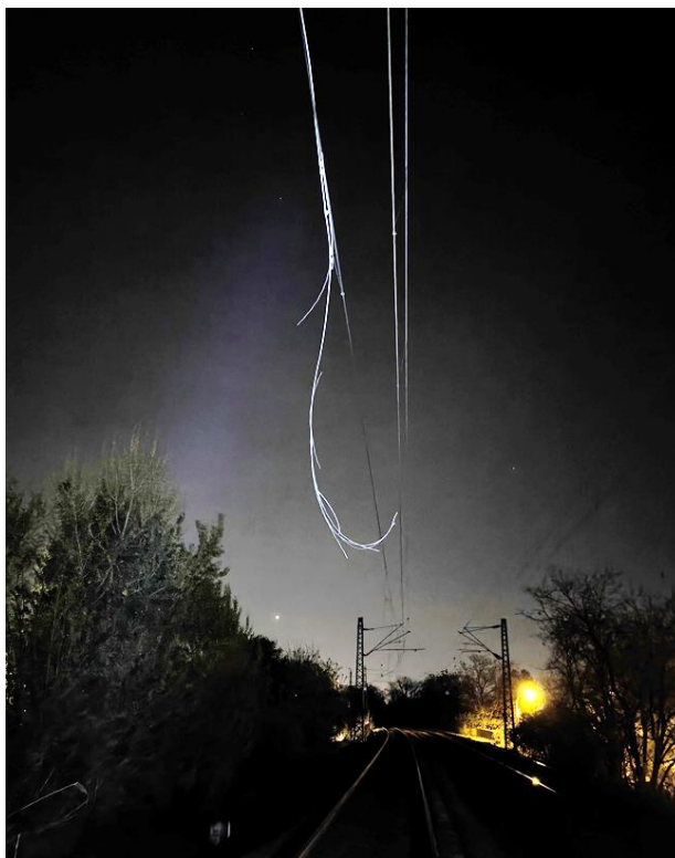
1. kép: Rongálódásos baleset Kelenföld és Budaörs állomásközben, 2024. április 5.