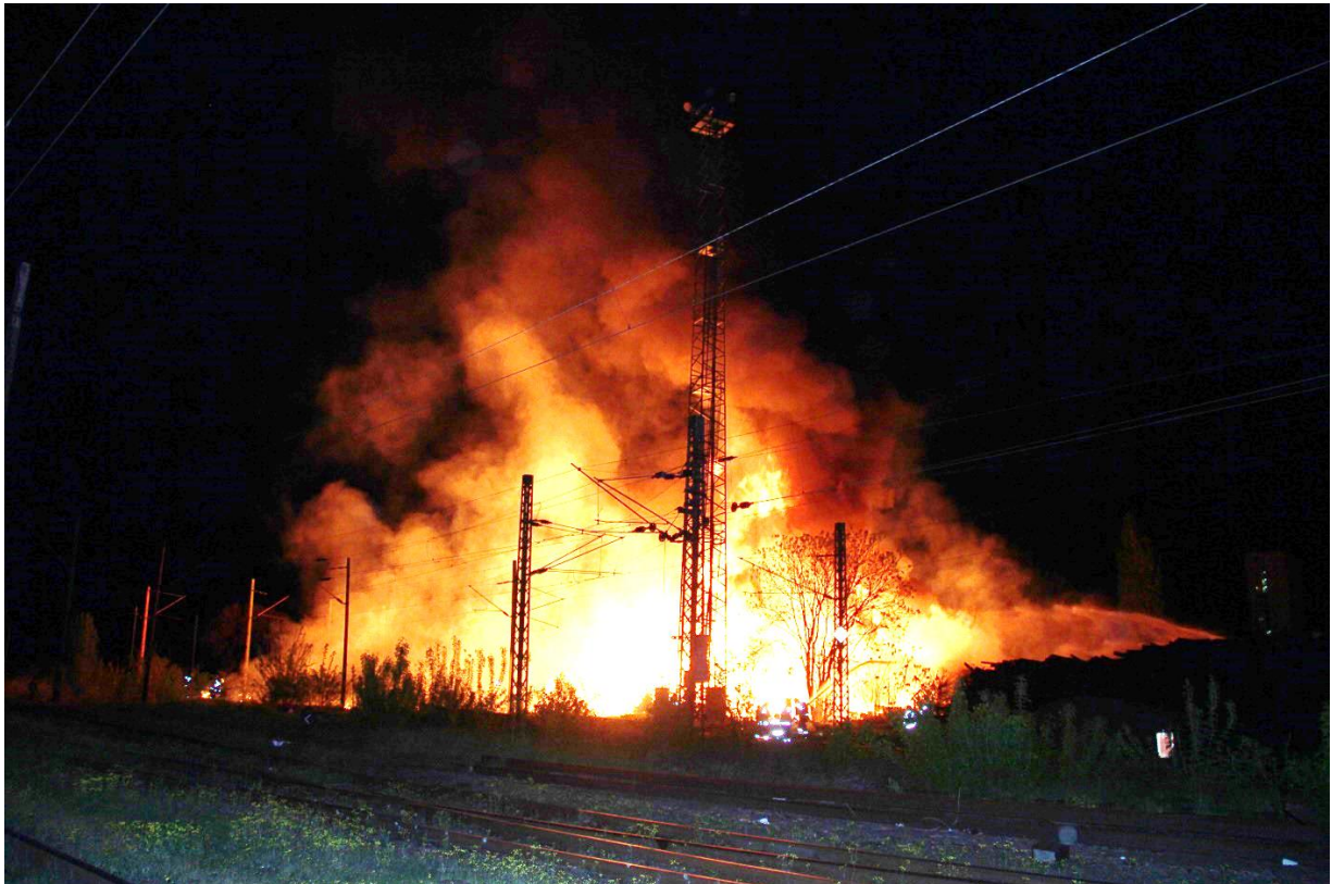
4. kép: Egyéb tüzeset Rákosrendező állomáson, 2024.április 8.

Rákosrendező állomáson tárolt talpfák, Vác állomáson a 256 sz. váltó melletti használaton kívüli épület, Szatymaz és Kiskundorozsma, illetve Kiskunfélegyháza és Kiskunmajsa állomások között pedig az avar égett. Mind a négy tüzeset vonatkéséseket okozott.