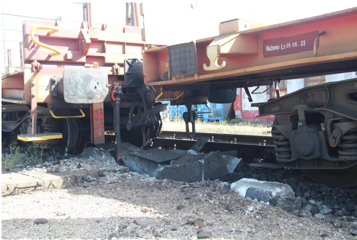
2. kép: Gurítás közben bekövetkezett baleset Ferencváros Keleti rendező pályaudvaron, 2024. április 19.