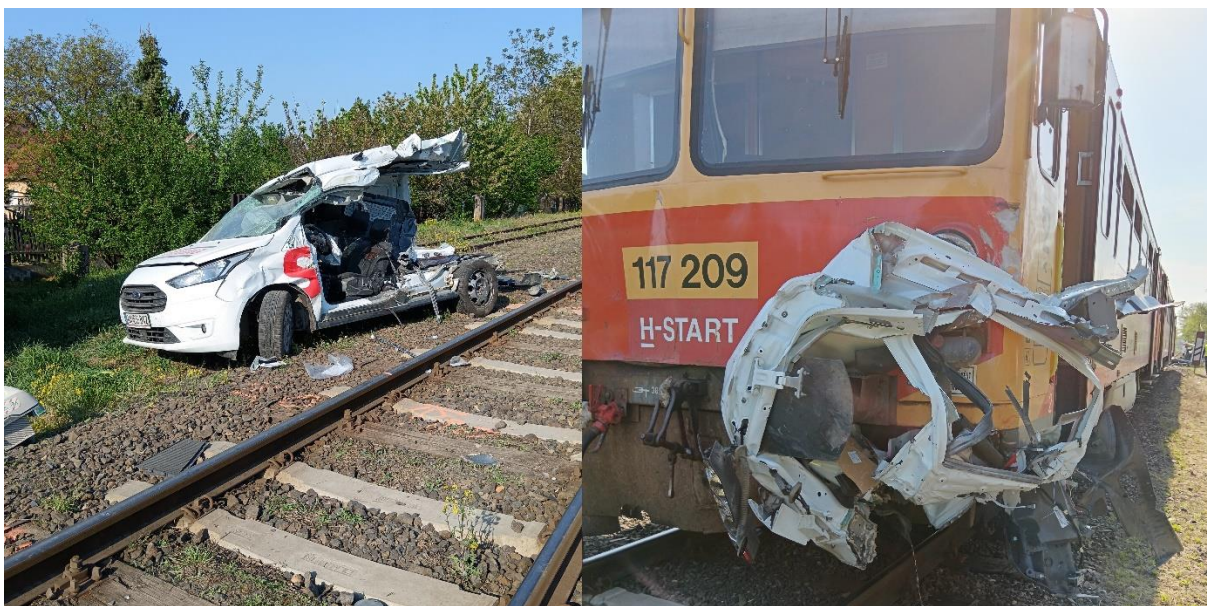
3. kép: Vasúti útátjáróban bekövetkezett baleset Kecskemét és Lakitelek állomások között 2024. április 11.